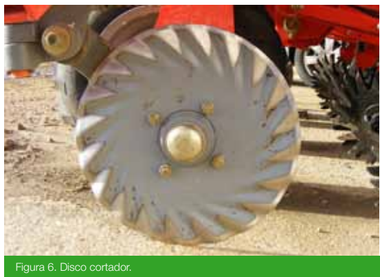
Figura 6. Disco cortador.

Los elementos cortadores están constituidos por discos que atacan los rastrojos en sentido vertical descendente cortándolos a la vez que abren un pequeño surco, cuya anchura viene dada por la forma del disco, y la profundidad es función del tipo y humedad del suelo, peso que gravita sobre él, y su diámetro.