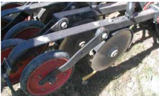
Figura 8. Sembradora de chorrillo equipada con doble disco de apertura del surco. Puede apreciarse la lengüeta que presiona la semilla contra el suelo.