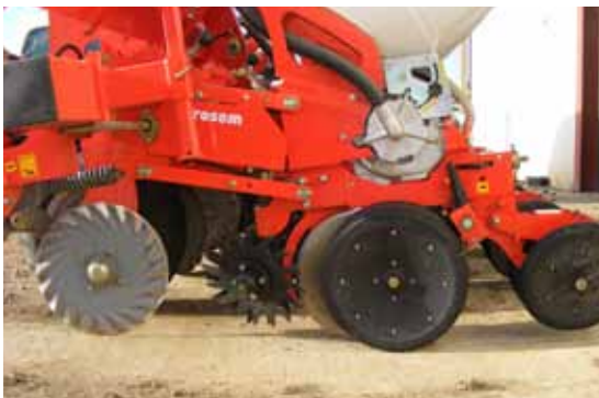
Figura 9. Tren de siembra en máquina monograno.