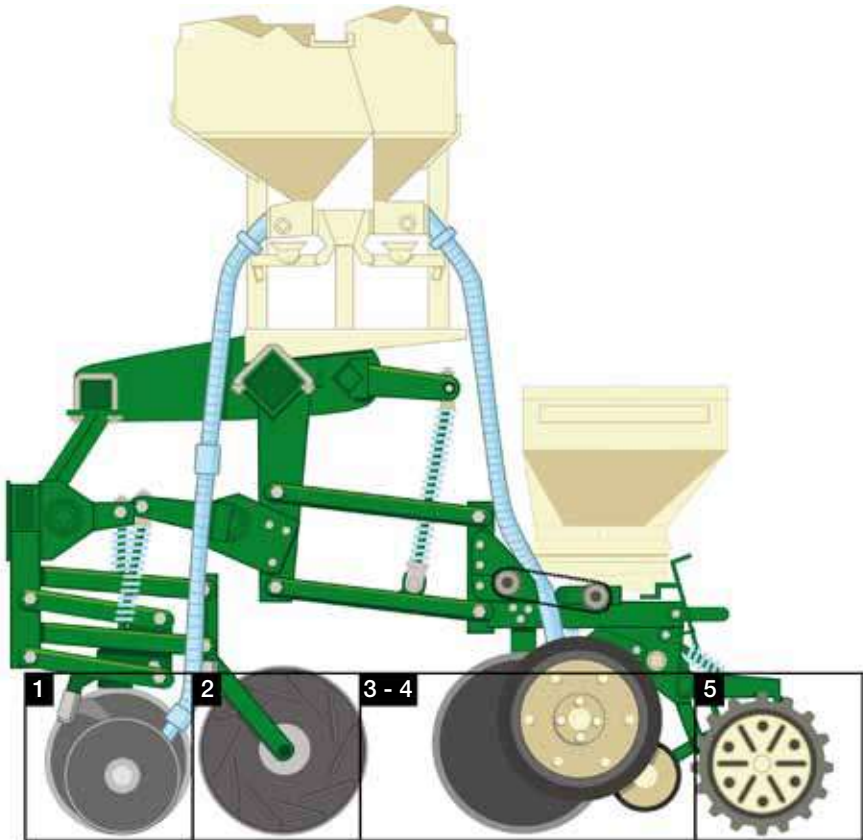
Figura 4. Esquema del tren de siembra de una sembradora directa de discos.