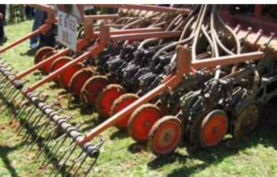
Figura 13. Detalle de la rastra de púas dispuesta tras el sistema de cierre del surco.

El cierre del surco se lleva a cabo mediante ruedas compactadoras ya sean simples o dobles, fabricándose tanto de goma como de nylon endurecido o metal. En función de las condiciones de uso se puede configurar la presión sobre el suelo así como el ángulo de ataque sobre el mismo (Figura 12).