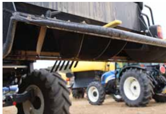
Figura 2. Detalle de deflector trasero.