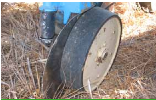
Figura 7. Sembradora equipada con disco abridor único y rueda neumática de control de profundidad.

El peso medio de una sembradora de discos a chorrillo varía entre 700 a 900 kg/m de anchura de trabajo para las de disco simple, aumentando hasta los 1.000-1.300 kg/m las de doble disco. La potencia mínima del tractor para las primeras es del orden de los 20 kw/m, mientras que las otras necesitan 25 a 30 kw/m. Para cultivos en hileras separadas (monograno o de precisión) la mayoría de las sembradoras utilizan triple disco, ondulado el de corte de restos y doble el de siembra con una o dos ruedas laterales de goma, que pueden modificar la posición de su eje con respecto al de los discos, con el fin de regular la profundidad de siembra (Figura 9). De manera opcional pueden montarse separadores de rastrojo.