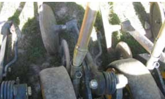
Figura 11. Tren de siembra con disco único, rueda fijadora, disco inclinado de cierre de surco al final y rueda neumática de control de la profundidad.