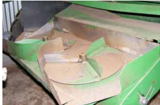
Figura 1. Detalle sistema esparcidor de restos en cosechadora de cereal.

Sin embargo, si la sembradora dispone de discos de corte de rastrojo estos trabajan mejor con la paja larga. De la misma forma si buscamos que los restos permanezcan más tiempo sobre el suelo, cuanto más alta sea la siega y menos picado estén estos menor será la degradación y por lo tanto mayor la protección de la superficie.