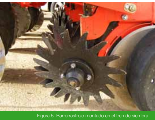
Figura 5. Barrerastrojo montado en el tren de siembra.