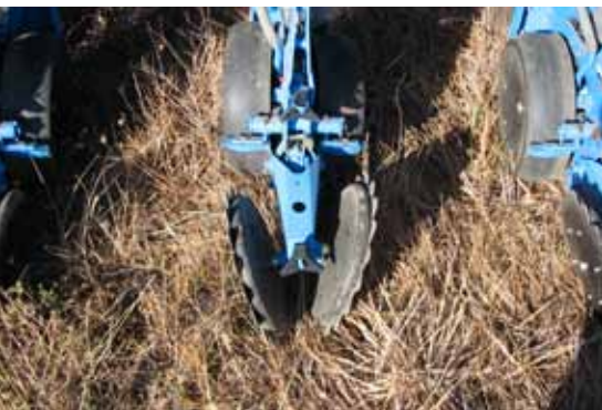
Figura 12. Detalle cierre de surco mediante disco doble.

Una vez depositada la semilla, es necesario cubrirla con tierra fina lo suficientemente apretada como para absorba la humedad del suelo y se inicie el proceso de germinación. En algunos modelos se coloca inmediatamente detrás de los abresurcos de siembra una pequeña rueda o una lengüeta, llamada fijadora, que aprieta la semilla contra el fondo antes de que intervengan los órganos de cierre, (Figura 11).