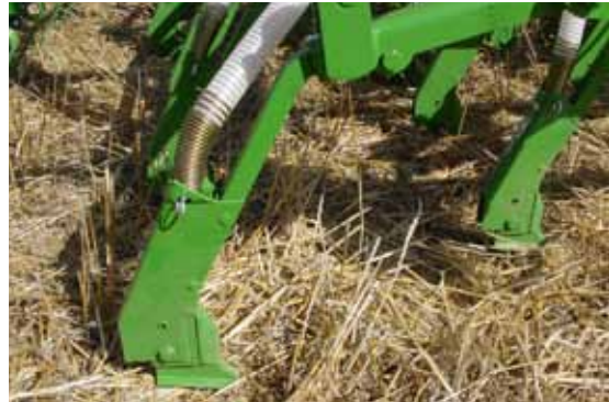
Figura 10. Sembradora de rejas.

El inconveniente principal es que, en terrenos con abundantes restos vegetales y poca separación entre los brazos de siembra, se pueden producir acumulaciones de residuos vegetales en ambos lados de la reja. Por otro lado, la precisión de la profundidad de siembra no es tan grande como el sistema de discos.